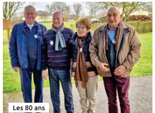
Les 80 ans