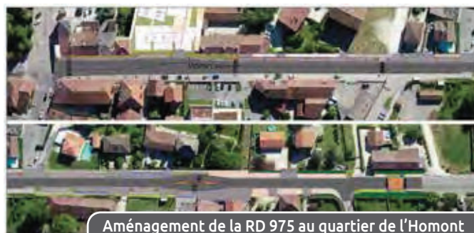
Aménagement de la RD 975 au quartier de l'Homont