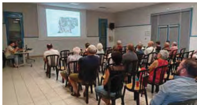
Présenté en réunion publique le 1 er juillet dernier

Présenté en réunion publique le 23 mai 2024